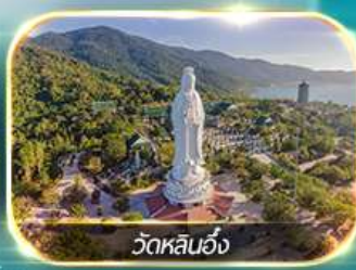
วัดหลินอึ้ง