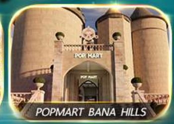
POPMART BANA HILLS

สัมผัสความงามหมู่บ้านฝรั่งเศสที่บานาฮิลล์ ช้อปปิ้ง POPMART เยือนเมืองโบราณฮอยอัน ล่องเรือกระดิง วัดหลินอึ้ง สะพานมังกร