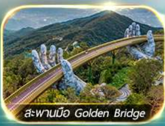
สะพานมือ Golden Bridge