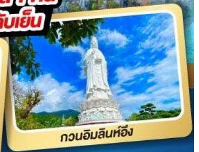
กวนอิมลินห์ฮิ่ง