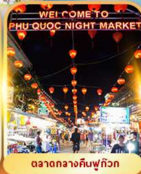
ตลาดกลางคืนฟู๊ควัก