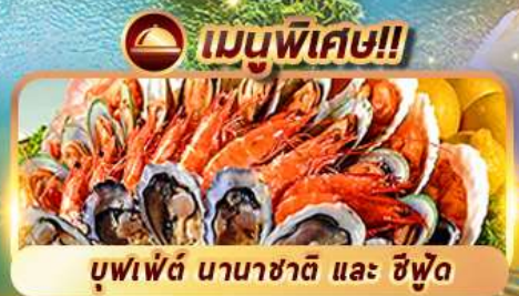
บุฟเฟ่ต์ นานาชาติ และ ซิวัด