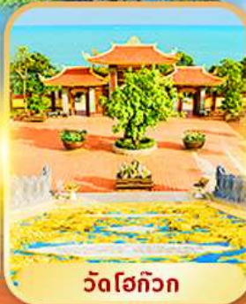
วัดโฮก๊วก