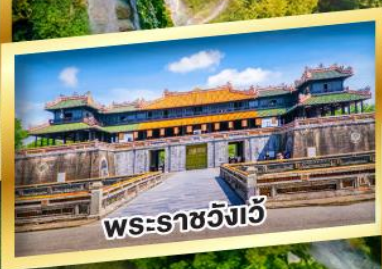
พระราชวังเว็