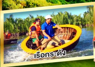
เรือกระดิง