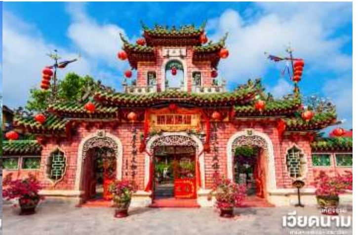
มัทศจรรย์ เวียดนาม