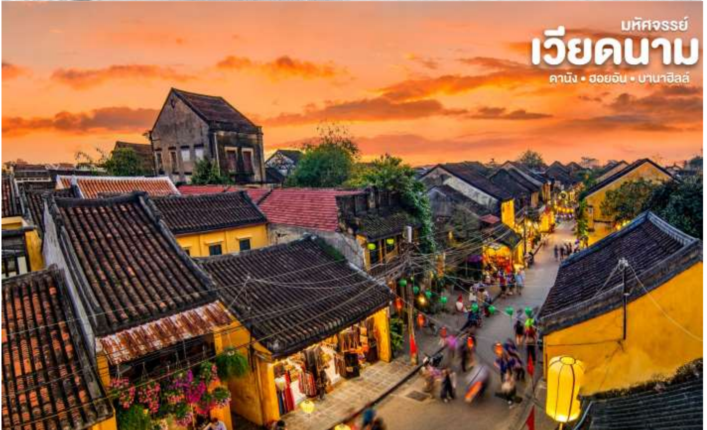
มัทศจรรย์ เวียดนาม คามิง • ฮอยอัน • บานาฮิลล์