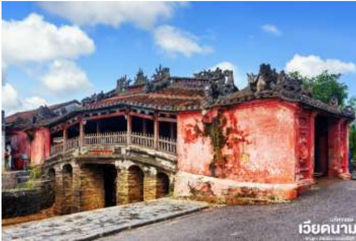
มัทศจรรย์ เวียดนาม