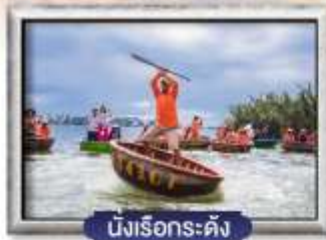
นั่งเรือกระดิง