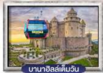
บาน่าฮิลล์เต็มวัน