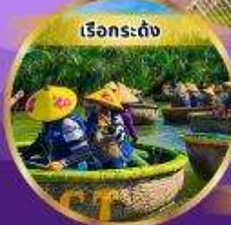
เรือกระด้ง

ราคาเริ่มต้น 14,555.- เมษายน - ตุลาคม 2568