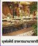
บุฟเฟ่ต์ อาหารนานาชาติ