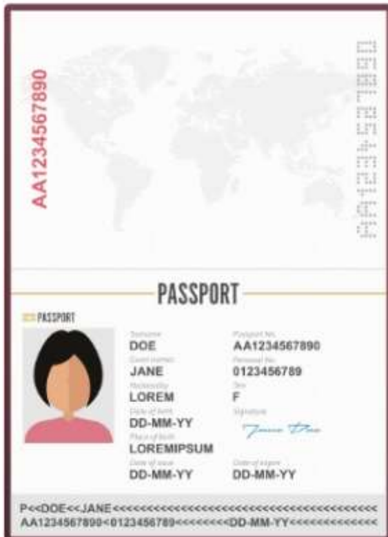
รูปถ่ายหน้าพาสปอร์ต