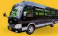
BUS (10-18 ท่าน)