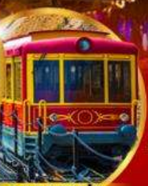
รถรางซาปา