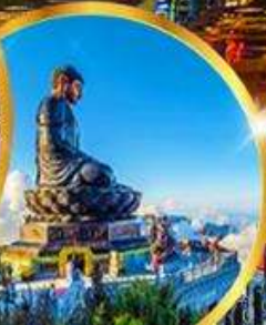
ฟานซีปัน