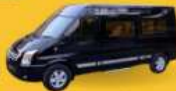
VAN (7-8 ท่าน)