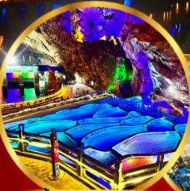
ถ้ำนงกวางแอน