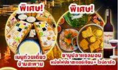
เมนูก๋วยเตี๋ยว ข้ามสะพาน