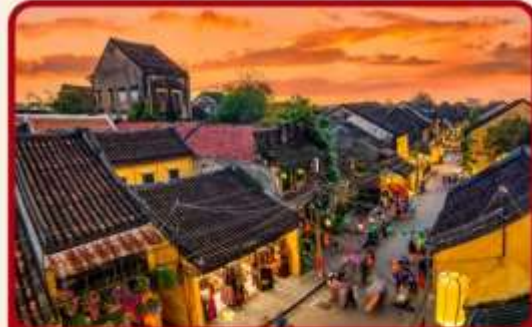
เที่ยวเมืองเก่าฮอยอัน