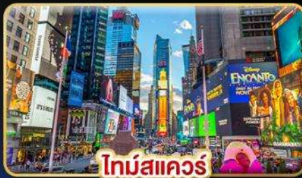
ไทม์สแควร์