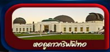
หอดูดาวกริฟฟิท

การันตี 10 ท่านออกเดินทาง พร้อมหัวหน้าทัวร์คนไทย