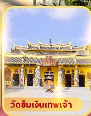
วัดยิมเงินเทพเจ้า