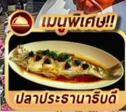
เมนูพิเศษ!! ปลาประจักษ์ริบตี