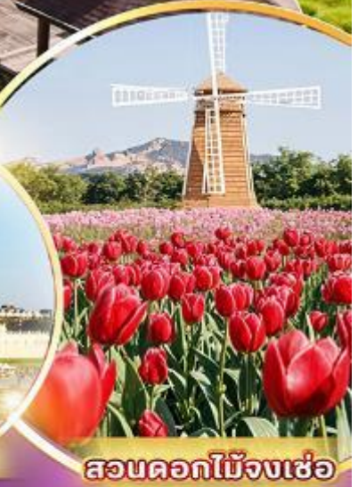
สวนดอกไม้เมืองเซ่อ

ชมสวนดอกไม้เมืองเซ่อ ฟาร์มแกะฮงจิง อู๋สุรณัฐสถานเจียงไคเช็ค ส่องเรือทะเลสาบสุริยันจันทรา วัดพระถังซำจั๋ง ป้อมน้ำพุร้อนเป่ย์ถั่ว วัดหลงซาน แวะถ่ายรูปปดิกไทเป 101 ซีเหมินติง ไถจงโมถ์มาร์เก็ต พิเศษ...เมฆหมอกนึ่งจักรพรรดิ เมฆเสี้ยวหลงเป่า เมฆซาบูบุฟฟ้าดัลสไตน์