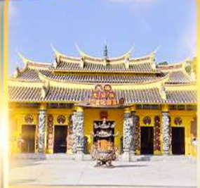
วัดซอพรเทพเจ้า