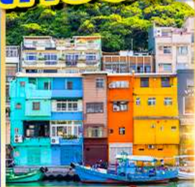
หมู่บ้านประมงเงินปิง

พักชิเหมินตง 2 คืน เที่ยวเต็ม!! ไม่มีวันอิสระ