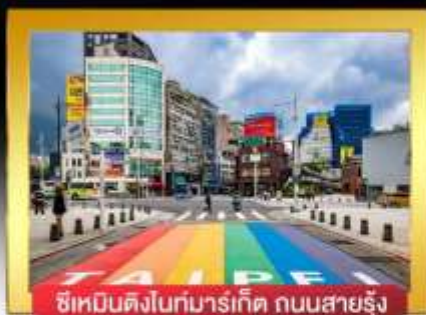
ซีเหมินติงไนท์มาร์เก็ต ถนนสายรุ้ง