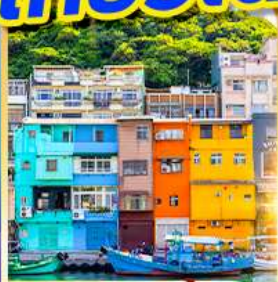
หมู่บ้านประมงเจินปิง