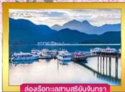
ล่องเรือทะเลสาบสุริยันจันทรา