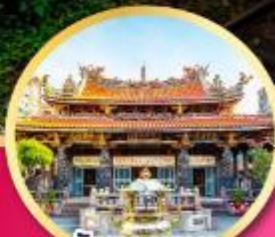
วัดหลงชาม