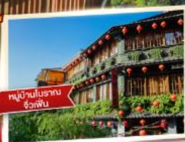
หมู่บ้านโบราณ จื่อกัฟิน