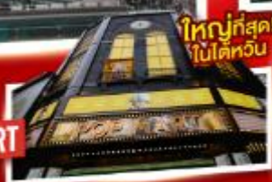
ใหญ่ที่สุด! ไต้หวัน