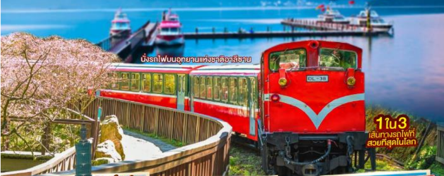
นั่งรถไฟบนอุทยานแห่งชาติอาลีซาน

ประกันการเดินทางอุบัติเหตุ คุ้มครองสูงสุด 3,000,000