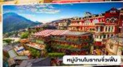
หมู่บ้านโบราณจั๋วเฟิ่น