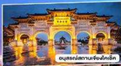
อนุสรณ์สถานเจียงไคเช็ก