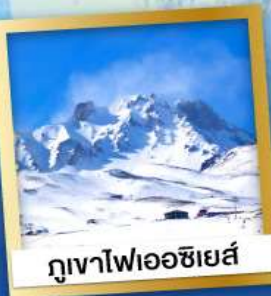
ภูเขาไฟเอซียส์