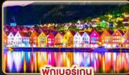
พักเบอร์เกน