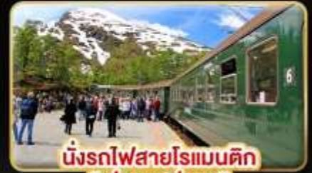
นั่งรถไฟสายโรแมนติก “ฟรอมสปาน่า”