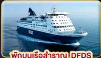
พักบนเรือสำราญ DFDS