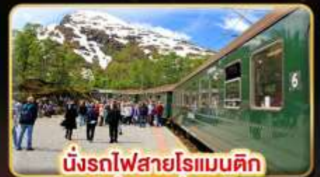
นั่งรถไฟสายโรแมนติก "ฟรอมสปานา"