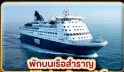
พักบนเรือสำราญ แบบ Window Room 1 คืน