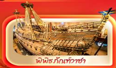
พิพิธภัณฑ์ท้าวชา