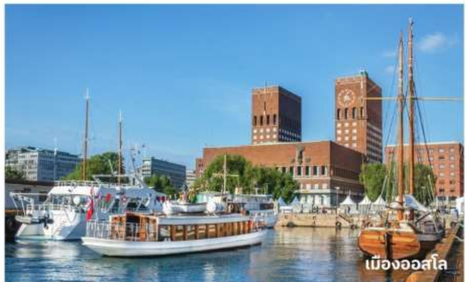
เมืองออสโล