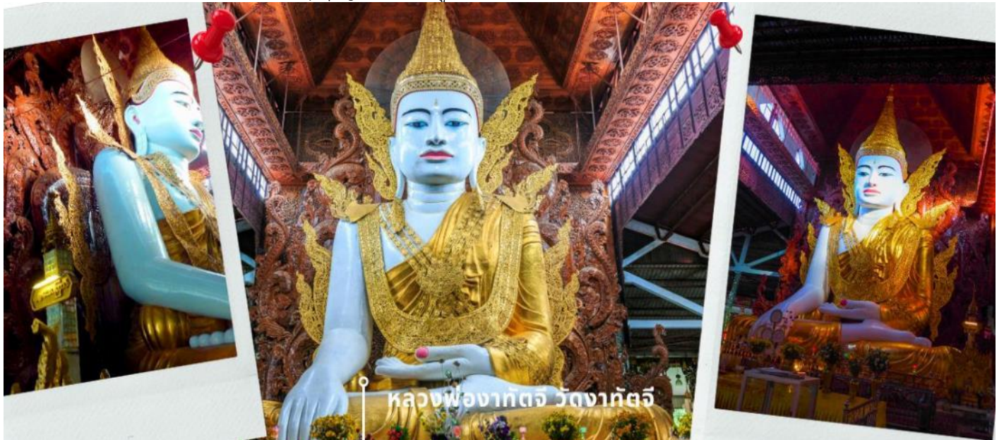
หลวงพ่องาทจจ วัดงาทจจ

จากนั้นสักการะ หลวงพ่องาทัจจี วัดงาทัจจี อย่างกึ่ง พม่า เป็นวัดที่ประดิษฐานพระพุทธรูปองค์ใหญ่ นั่นคือ หลวงพ่องาทัจจี แปลว่า "หลวงพ่อที่สูงเท่าตึก 5 ชั้น" เป็นพระพุทธรูปปางมารวิชัยที่แกะสลักจากหินอ่อน ทรงเครื่องแบบกษัตริย์ ส่วนด้านหลังเป็นไม้สักแกะสลักลวดลายต่างๆ จำลองแบบมาจากพระพุทธรูปทรงเครื่องสมัยยะตะนะโบง (สมัยมณฑลเลย) ส่วนประตูทางเข้าวัดงาทัจจีก็ประดับตกแต่งอย่างหรูหราด้วยหลังคาสีทองทรงปราสาทแบบพม่า 5 ชั้น และมีรูปปั้นสองสิงห์แบบศิลปะพม่าหรือชินเต (Chinthe) เป็นทวารบาลอยู่ด้านหน้า วัดงาทัจจี ตั้งอยู่ที่ Ashay Tawya Monastery เมืองย่างกึ่ง ตรงข้ามวัดเจ้ากัตจี (Chauk Htat Gyi pagoda) หรือที่รู้จักกันในชื่อ “วัดพระตาหวาน” นั่นเอง