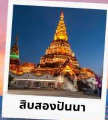
สิบสองปันนา