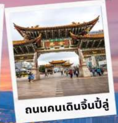
ถนนคนเดินจีนปี้ลู่