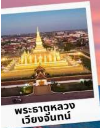
พระธาตุหลวง เวียงจันทน์