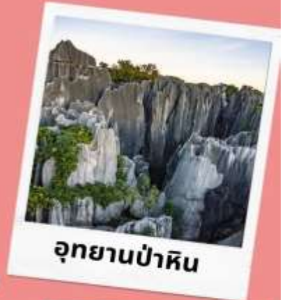
อุทยานป่าหิน