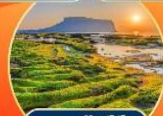
หาดคยุงชีกี