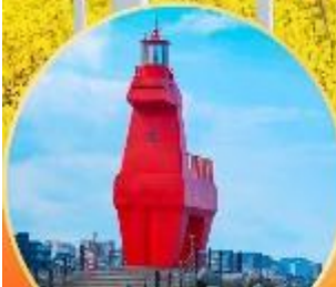
ชายหาดวีไฮเนทอู