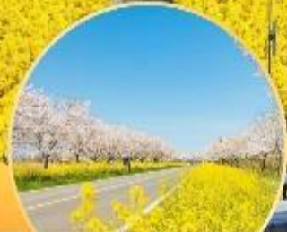
ซากระ / ชุงดอกแรพ