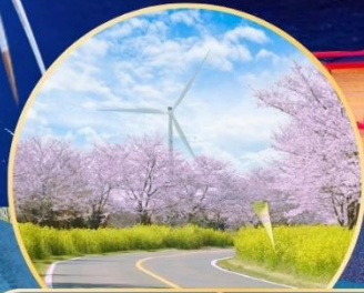
ชาทุระ / ทุ่งดอกเรป