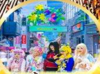
ช้อปปิ้ง ฮาราจูกุ