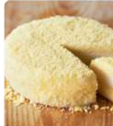
ร้าน LeTAO ร้านมีผลิตภัณฑ์อร่อย อีกรอบมาจาก ร้านกาแฟชื่อดังในโตเกียวเมือง ด้วยนางลาวจากแบบมีดีปิ้ง