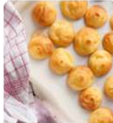
ร้าน KITAKARO ยังมีขนมอบจากเตาอบๆ ใหม่ๆ ให้ลองชิมลิ้มรสกันเลยทีเดียว และเหมาะที่จะซื้อของฝากเป็นอย่างดี