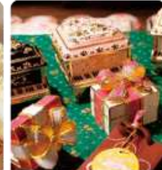
กล่องดนตรี MUSIC BOX