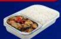
ข้าวกะเพราไก่