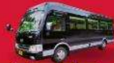
BUS (10-18 ท่าน)