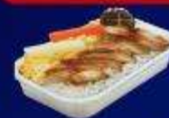
ข้าวหน้าไก่ย่างเทรียกกี