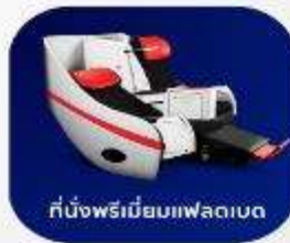
ที่นั่งพรีเมียมแพลตเบด