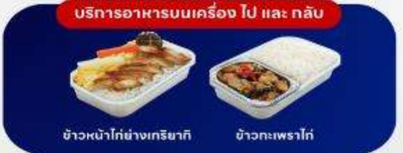
บริการอาหารบนเครื่อง ไป และ กลับ