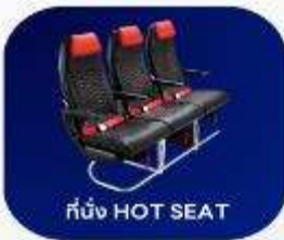
ที่นั่ง HOT SEAT