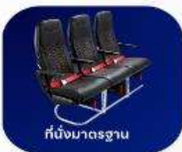
ที่นั่งมาตรฐาน