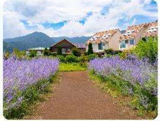
สวนโออิชิ พาร์ค

สวนดอกไม้โออิชิ พาร์ค (Oishi Park) มหัศจรรย์แห่งวิวกุเขาไฟฟูจิ หนึ่งในจุดชมวิวกองกุเขาไฟฟูจิที่สวยงามที่สุดอีกจุดหนึ่ง ที่จะเติมเต็มความสงบและความงดงามของธรรมชาติในญี่ปุ่นเมื่อไปเยือน คือสถานที่ที่ไม่ควรพลาด สวนดอกไม้โออิชิ พาร์ค (Oishi Park) แห่งนี้ไม่ได้เป็นเพียงสถานที่ที่มีดอกไม้สวยงามให้เราได้ชื่นชมแล้ว จุดเด่นของสวนนี้คือวิวกุเขาฟูจิที่อยู่เบื้องหลังสวนดอกไม้สีแสนสดใส ที่บานสะพรั่งในทุกฤดูกาล และยังเป็นมุมที่ทำให้เราได้สัมผัสกับวิวกุเขาฟูจิได้อย่างใกล้ชิด จากนั้นนำพาทุกท่านสู่..