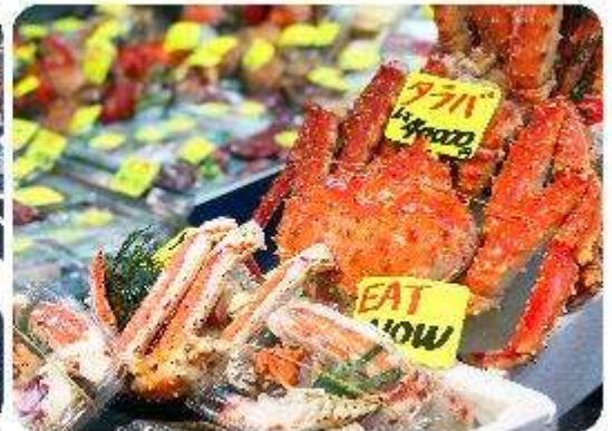
ตลาดปลาซึกิจิ

แนะนำที่เกี่ยว อิสระด้วยตัวเอง - ตลาดปลาซึกิจิ Tsukiji Outer Market ตลาดปลาชื่อมีชื่อเสียงของญี่ปุ่น และยังเป็นหนึ่งในตลาดปลาที่ใหญ่ที่สุดในโลกด้วยค่ะ ตั้งอยู่ในโตเกียว ตลาดแห่งนี้มีการซื้อขายอาหารทะเลมากกว่า 2,000 ตันต่อวัน โดยโซนภายในตลาดนั้นจะแบ่งออกเป็น 2 ส่วน ก็คือ ส่วนด้านนอก ที่มีร้านค้าปลีกและร้านอาหารอยู่เรียงรายให้เราได้เลือกซื้ออาหารทะเลสดๆ รับประทานกัน