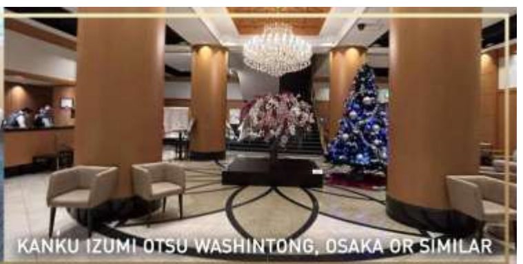
KANKU IZUMI OTSU WASHINTONG, OSAKA OR SIMILAR