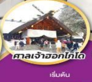
ศาลเจ้าออกโทโด

ชมความน่ารักของน้องๆ ที่สวนสัตว์อาซาฮิยาม่า