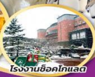
โรงงานช็อคโกแลต