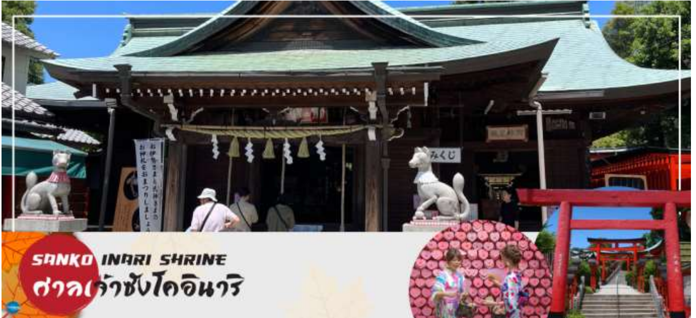
SANKO INARI SHRINE ศาลเจ้าซังโคอินาริ

จากนั้นนำท่านเดินทางสู่ ศาลเจ้าซังโคอินาริ (Sanko Inari Shrine) ตั้งอยู่ใกล้ๆ กับปราสาทอินุยามะ ศาลเจ้านี้มีชื่อเสียงเรื่องความรัก คู่รักมักจะมาขอพรให้มีความสัมพันธ์ที่ดี ชีวิตคู่ราบรื่น ครองรักกันยาวนาน ส่วนคนโสดก็จะขอให้ได้พบเจอคู่แท้จุดเด่นคือเสาโทริอิสีแดงที่เรียงรายสวยงาม และแผ่นป้ายขอพรรูปหัวใจสีชมพู ที่นี้ยังช่วยเรื่องการเงินอีกด้วย ว่ากันว่าถ้านำเงินมาล้างที่บ่อน้ำศักดิ์สิทธิ์ภายในศาลเจ้า จะช่วยให้เงินนั้นงอกเงยขึ้นหลายเท่า ครอบครัวยุคเร่ร่อนเรื่อง