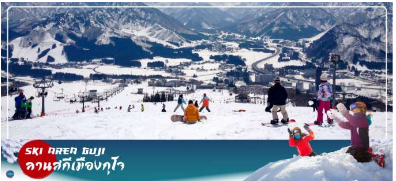
SKI AREA GUJI ลานสกีเมืองกุโจ

วันที่สาม เมืองกุโจซากิมัง – ลานสกีเมืองกุโจ – เมืองกิฟู – หมู่บ้านมรดกโลกชิราคาวาโกะ – เมืองทาคายามะ – ถนนชั้นมาจิซุจิ – เมืองนาโกย่า