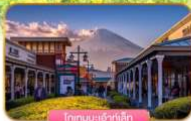
โทเทมเบะเฮ้าส์เสท