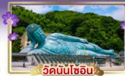
วัดนันโซอิน