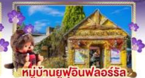
หมู่บ้านยูฟูอินฟลอร์ริล