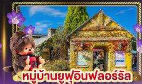
หมู่บ้านยูฟูอินฟลอร์ริล