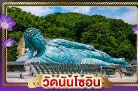
วัดนินโซอิน