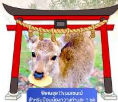
พิเศษสุด!! ชมเมฆเมบิกิ สำหรับบือนเมืองกวางาโน่: 1 จุด