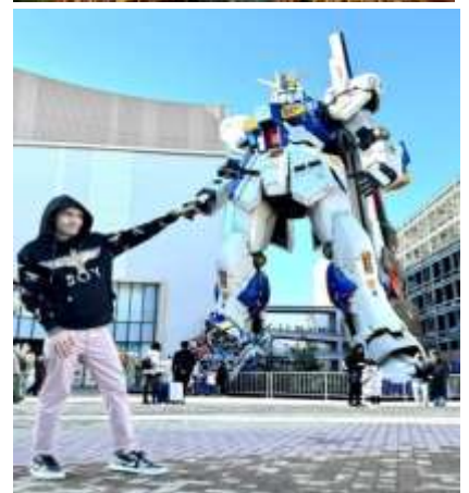
หุ่นกันดั้ม ชื่อ RX93 FF Nu Gundam

เดินทางต่อไปยัง ร้านค้า DUTY FREE ให้ท่านได้ช้อปปิ้งสินค้าปลอดภาษีที่มีคุณภาพ อาทิ เครื่องสำอาง โฟมล้างหน้า(แนะนำ) อาหารเสริม ขนม เครื่องใช้ต่างๆ ฯลฯ ...จากนั้นแวะ แชะรูปกับหุ่นกันดั้มยักษ์ ณ ห้าง LaLaport (หากมีเวลาพอ) มีขนาดใหญ่กว่า Unicorn Gundam ที่โตเกียวและใหญ่กว่า RX93 FF Gundam ที่ Gundam Factory Yokohama เรียกได้ว่าเป็นแลนด์มาร์คสำคัญของเมืองฟูกูโอกะในปัจจุบัน ...จากนั้นอิสระให้ท่านช้อปปิ้ง ย่านเทนจิน (Tenjin) หรือ ย่านฮาคาตะ (Hakata) เป็นย่านช้อปปิ้งขนาดใหญ่ใจกลางเมือง รวบรวมแหล่งบันเทิง อย่างครบครัน ไม่ว่าจะเป็นตึกต้นไม้ ร้านค้าที่น่าสนใจ และบรรยากาศสุดคลาสสิก หรือจะเป็นย่านของกินอร่อยๆ อย่างย่านยะไต (Yatai) หมายถึง ชุมชนอาหารที่มีขนาดไม่ใหญ่มาก ที่รวมร้านอาหารแบบฉบับท้องถิ่นเอาไว้มากมาย