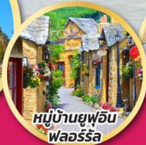
หมู่บ้านยูฟูอิน พลอร์ริล