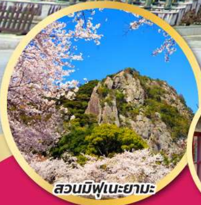
สวนมิฟูเนะยามะ