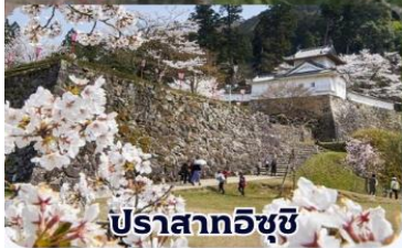
ปราสาทอิซุชิ