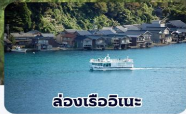
ล่องเรืออินะ