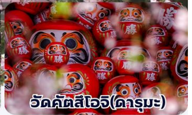
วัดคิตสึโอจิ(ดาร์มะ)