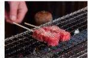
รูปประทานอาหารกลางวัน ณ ภัตตาคาร