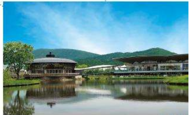
อีโอสระอาหารกลางวันที่ตามฮิโรฮะชิ (ไม่รวมในรายการ)