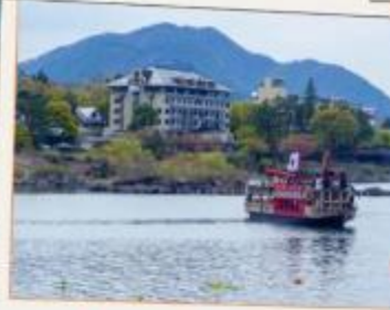
ล่องเรืออาปาเระ