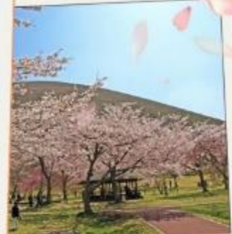
ซากุระ โนะ ซาโตะ