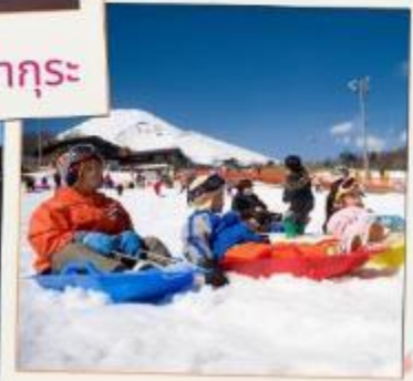
ลานสกีเยติ