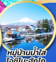
หมู่บ้านน้ำใส โอชิโนะอึกิโก