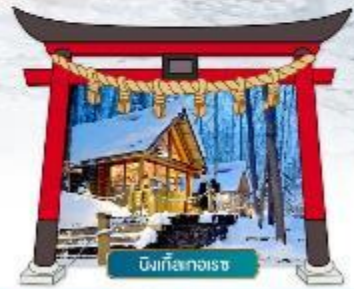
นิงเกิลเกอเรซ