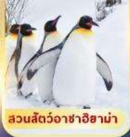
สวนสัตว์อาซาฮิยาม่า