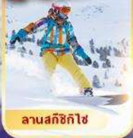
ลานสกีซิกิไซ