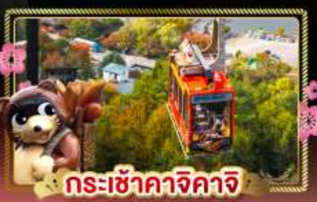
กระเช้าคาจิคาจิ