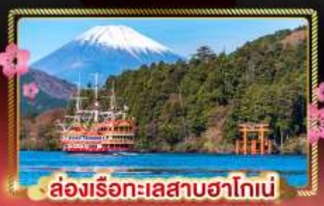
ล่องเรือทะเลสาบฮาโกเน่