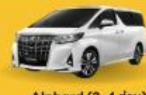
Alphard (2-4 ท่าน)