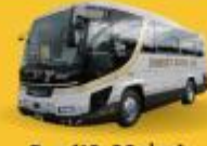
Bus (10-20 ท่าน)