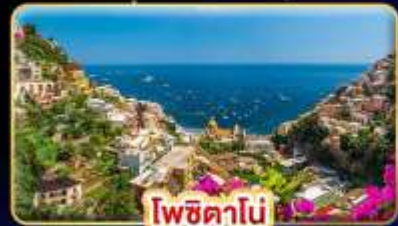
โพซิตาโน